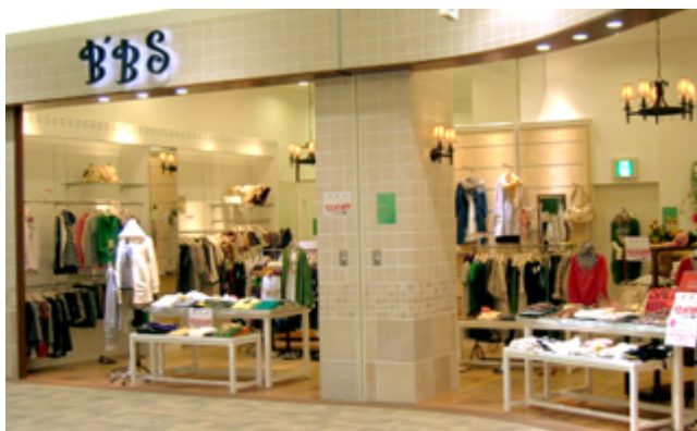
B'BS ゆめタウン広島店