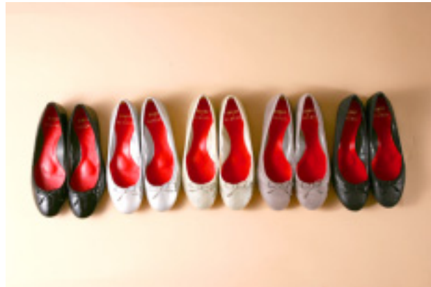
21.5cm ~ 25.0cm まで 8 サイズ 全 5 色

株式会社 千趣会(本社 大阪市 代表取締役社長 行待裕弘)のオリジナルシューズブランド『BENE BIS(ベネビス)』は、京阪神エルマガジン社発行の月刊女性誌『SAVVY(サヴィ)』とコラボレーションし、“旅”をコンセプトにした「バレエシューズ」をこのほど共同開発いたしました。6月5日(火)より、弊社が運営する総合オンラインショップ、ベルメゾンネット内の特別サイト( http://www.bellemaison.jp/savvy )で、500 足限定で販売開始いたしました。