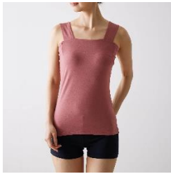
「チラ見えを防ぐ」シリーズ

胸元や背中がすっきりしたデザインに加えて、幅広のストラップでブラジャーの紐をしっかりと隠し、ブラ紐が見えない「チラ見えを防ぐ」シリーズをご提案。スクエアの襟ぐりや脇高設計で、前かがみになった時や腕を上げた時の「チラ見え」を防ぐので、安心してトレンドのファッションを楽しんでいただけます。ワンピース用のスリップデザインや、「大汗さん」シリーズでは前後広めのワイドネックデザインも展開しています。