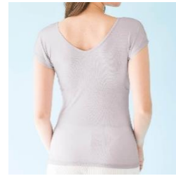
ワイドネックデザイン(大汗さん)