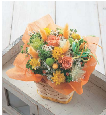
【スマイルシーズ共同開発商品】