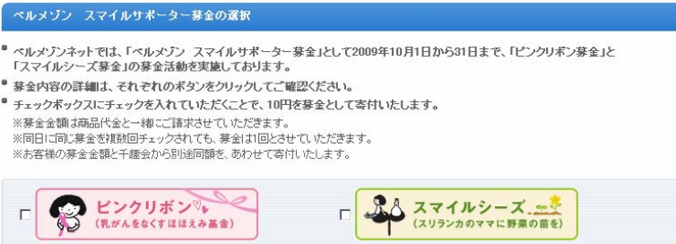
ベルメゾンネット募金選択画面

2009年10月1ヶ月間限定で、ベルメゾンネット（PCのみ）で行ったお買い物の際に参加できる10円のクリック募金。お客様が賛同した額と同額を千趣会も寄付するものです。10月はピンクリボン月間であるため、千趣会が女性支援を行っている『ピンクリボン』と国際貢献NGOと共にスリランカのお母さんに野菜の種や苗を送ることで自立を支援する『スマイルシーズ』の2種類の募金活動を実施。1ヶ月間で『ピンクリボン』は1,409,400円、スマイルシーズは1,205,240円と予想を大きく上回る結果となりました。来年以降も同じ女性支援や環境などメニューを替えて活動予定です。