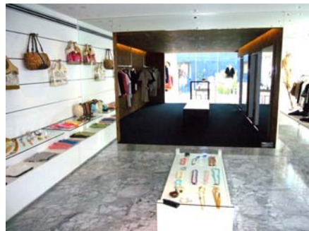
ルボンディール PFR 南青山店内