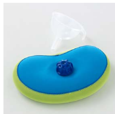
なごみ湯たんぼ「ちゃぼたん」じょうご付き