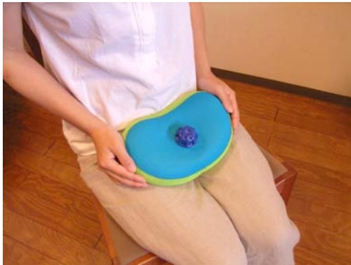
おなかや太ももを温める夏用の湯たんぽ

～8月22日発売の夏用湯たんぽ『ちゃぼたん』を先行予約販売！冷えとりアイテムも勢ぞろい！～