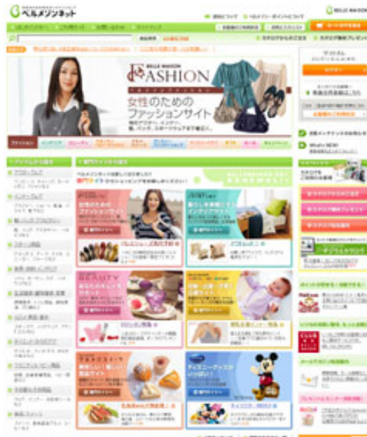
PC サイト TOP

～総合通販サイトからファッション、インテリアなど複数の専門サイト展開へ～ オンラインショップ「ベルメゾンネット」8月4日リニューアル！