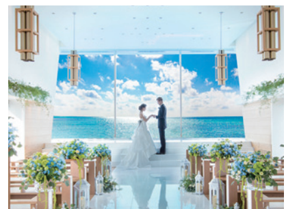
蒼い海と空、 光が包む感動の挙式 「シーサイドホール」