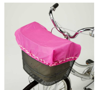
④カゴにかぶせるだけ