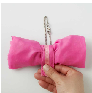
①リボンの状態からほどいて