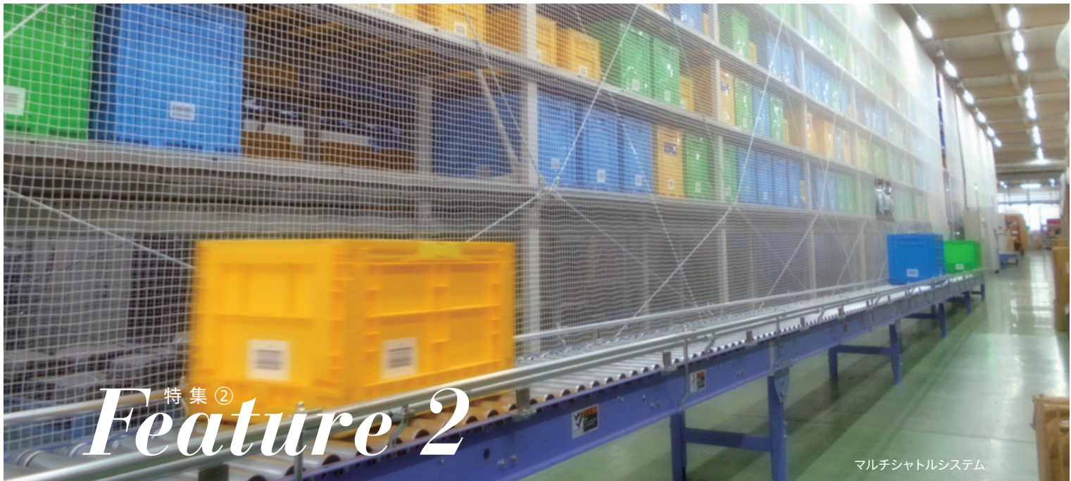
マルチシャトルシステム