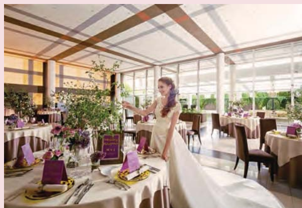
(株)プラネットワークのゲストハウス「mia via」

これらの取り組みにより、次期の当事業の売上高は173億50百万円(当期比13.5%増)、営業利益は8億30百万円(当期比21.6%増)を計画しています。