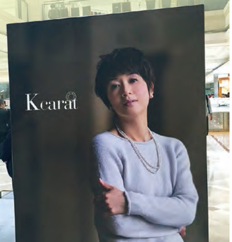
大丸神戸店での 限定ショップ